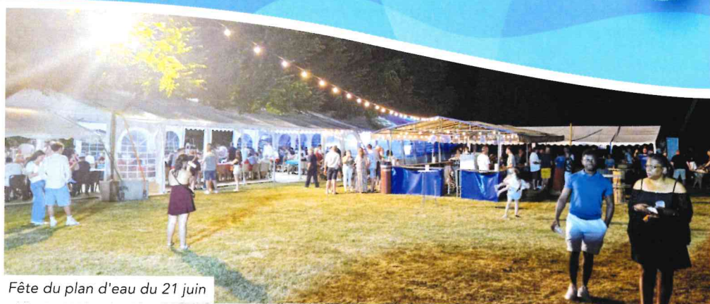
Fête du plan d'eau du 21 juin