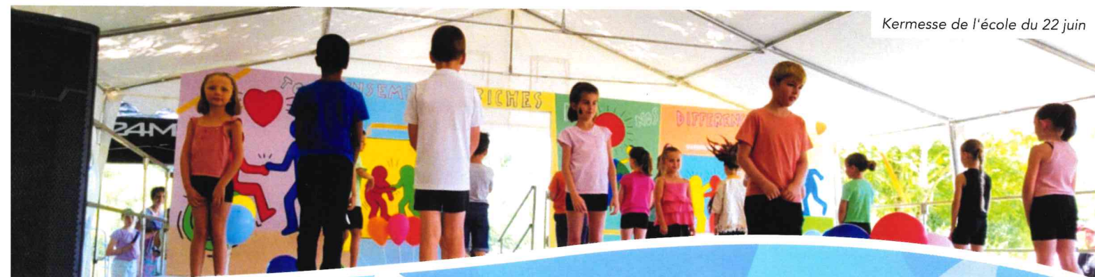
Kermesse de l'école du 22 juin