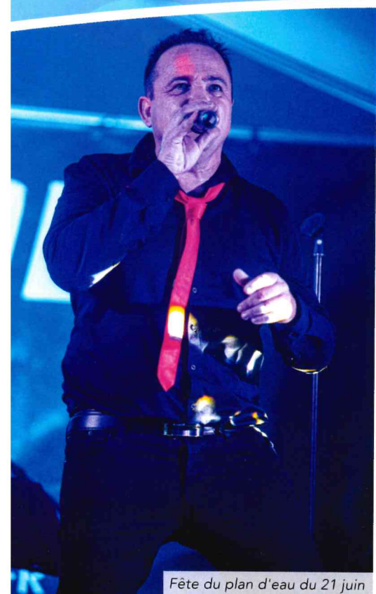
Fête du plan d'eau du 21 juin