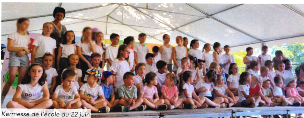
Kermesse de l'école du 22 juin